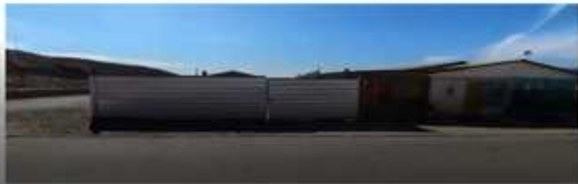
Imagen 2.- Frente sitio 1.