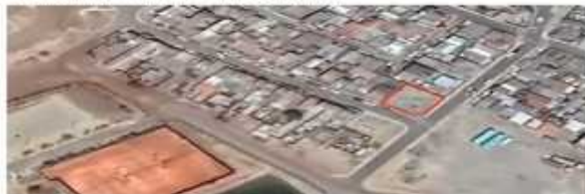
Imagen 1.- Ubicación terreno solicitada.

a.- El terreno solicitado está ubicado en la esquina poniente de calle Arauco con Eleuterio Ramirez, corresponde a un terreno de propiedad municipal, donde la SECPLA de la Municipalidad de Huasco, generó un proyecto de plazoleta, el cual ya está aprobado técnicamente por la SUSDERE, estando en estado de elegible en la plataforma de los proyectos PMU.