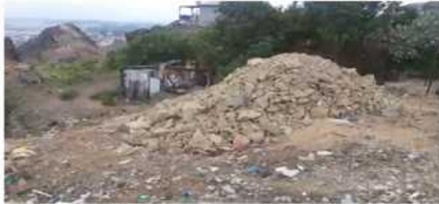
Imagen 2.- Material depositado en el lugar.