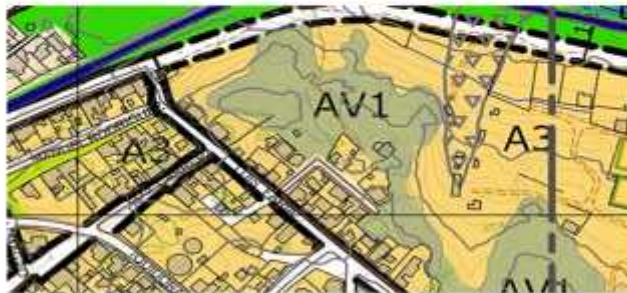
Imagen 7.- Uso de suelo definido por el Plan regulador de Huasco.