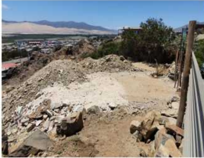
Imagen 5.- Rellenos en el lugar.

- Sr. Cortes, expone al concejo las partes técnicas lo que es el terreno y lo que indica el Plan Regulador proyectado en la imagen.