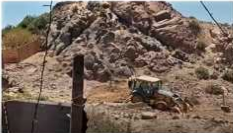
Imagen 3.- Maquinaria trabajando en el lugar, fotografía enviada por vecino.