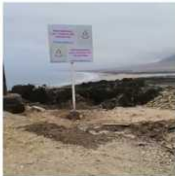
Imagen 4.- Letrero indicativo instalado en el lugar.

prohibición de tomas en el lugar, lamentablemente el letrero fue retirado por desconocido en menos de 24 hrs.