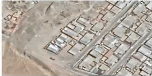
Imagen 1.- Ubicación de los 7 sitios tras pasaje los olivos 10.