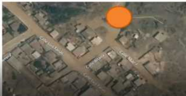
Imagen 1.- En color naranja se indica terreno donde se realizan los trabajos de relleno.