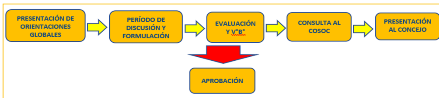
DIAGRAMA DE LAS ETAPAS